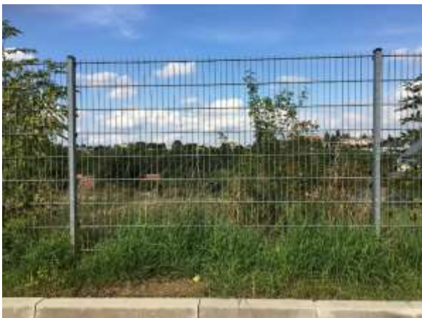
Ocelové svařované drátěné plotové panely 2D, žárový zinek, vysoké oplocení