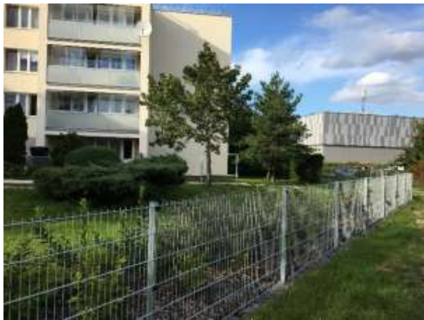
Ocelové svařované drátěné plotové panely 2D, žárový zinek, nízké oplocení